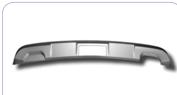
KIA SORENTO | Heckschürzenansatz | KIA/SOR-HE1