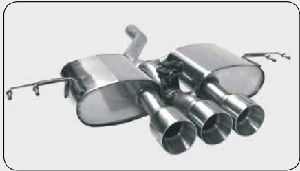
Triple RACE Ø 100 mm wahlweise mit und ohne Abgasklappe en option avec ou sans clapet d'échappement either with or without exhaust flap opcionalmente con o sin válvula de escape