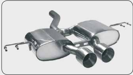
Double RACE Ø 100 mm